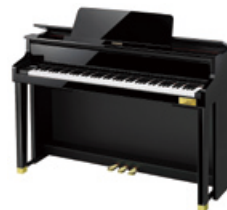
CELVIANO Grand Hybrid GP-500BP